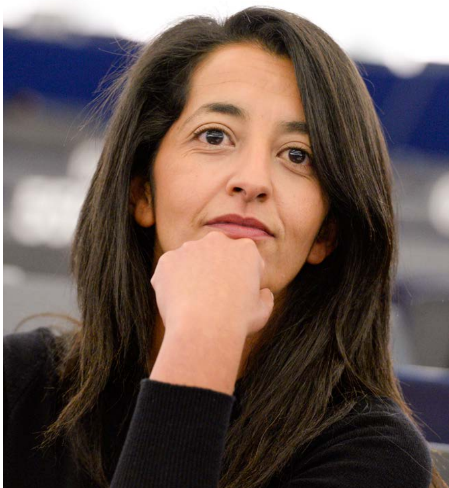
Karima Delli.

L e plafond de verre? Quel plafond de verre? Karima Delli ne connaît pas. Neuvième d'une famille de treize enfants, elle se souvient de ce soir de juin 2009 où, âgée de 30 ans et tout juste élue dépu-