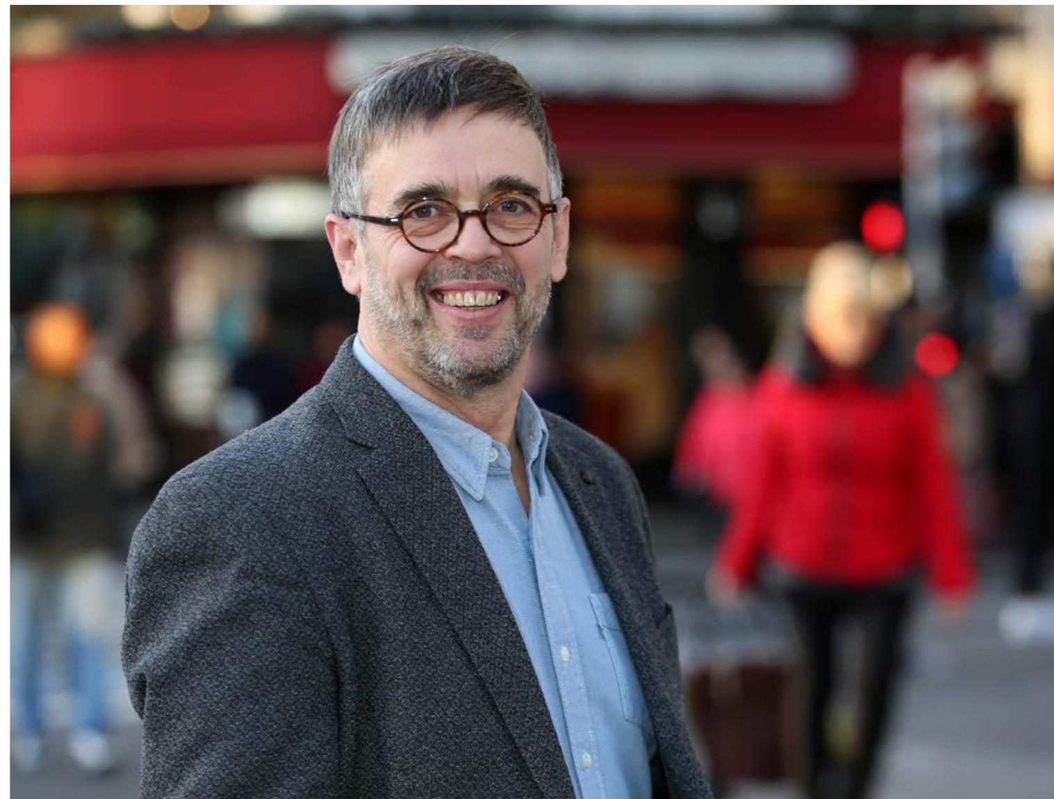
Damien Carême.

poser industrie et urgence climatique, mais utiliser l'une pour combattre l'autre, et pour ça il fallait réfléchir en termes d'écosystème et d'optimisation des ressources