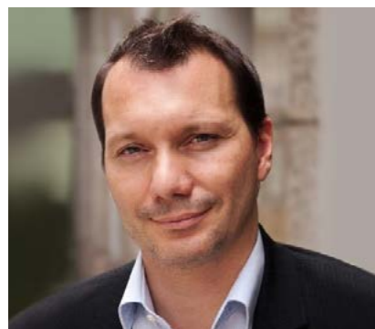
David Cormand, Secrétaire national EELV et candidat à l'élection européenne.