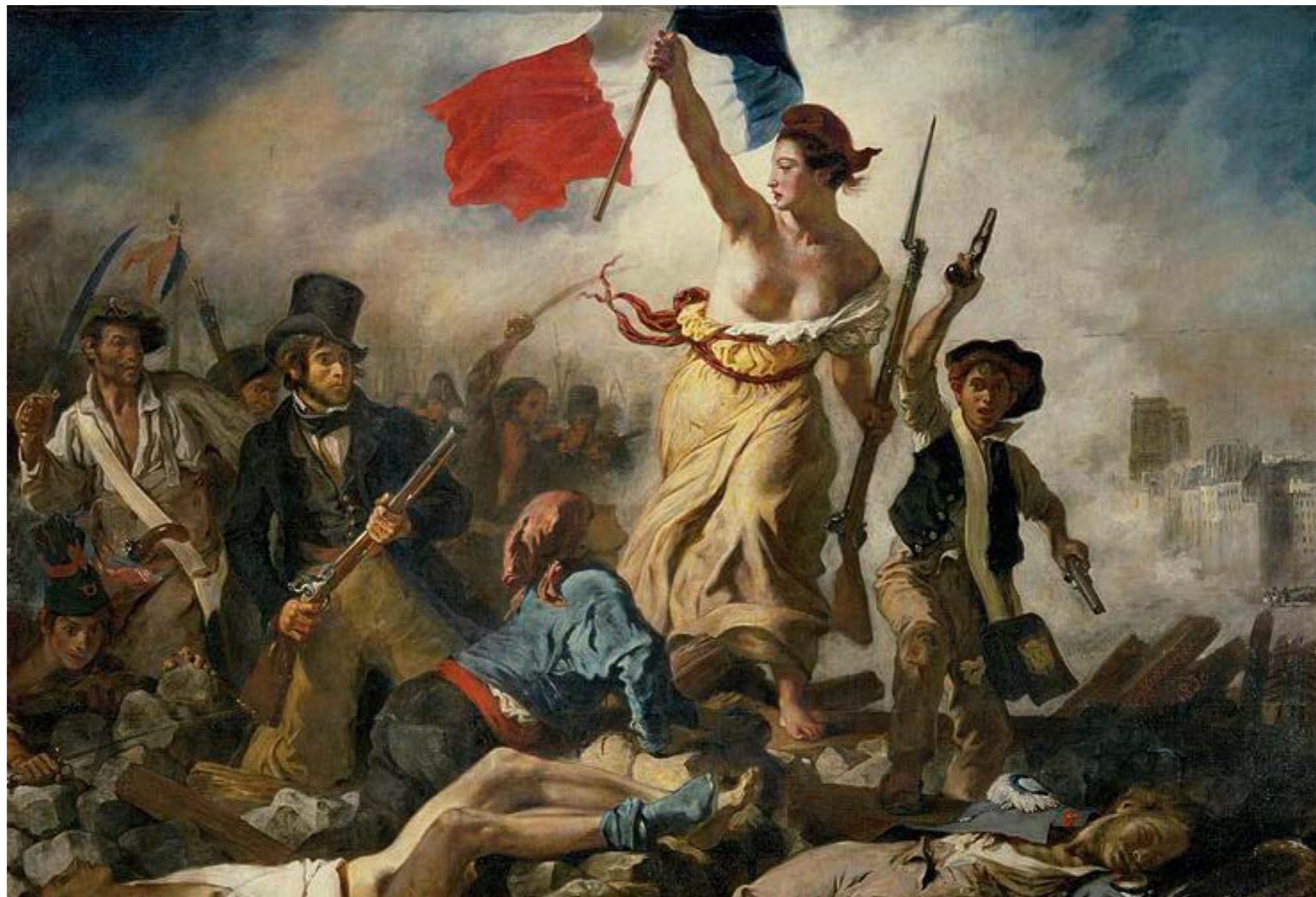
Eugène Delacroix - Le 28 Juillet. La Liberté guidant le peuple

à la retraite et stagnation des salaires, coupe dans les dépenses de l'Etat et recul du service public, concentration des efforts sur les métropoles pour peser dans la mondialisation et augmentation des inégalités territoriales... Pourtant, les conditions de vie de toute une partie de la population continuent de se dégrader. L'Europe reste certes plus protectrice que les États-Unis grâce à ses systèmes de protection sociale. Mais le repart social contre la pauvreté construit durant l'après-guerre s'éboule avec le temps, surtout sous l'érosion des politiques libérales et avec l'adhésion sans réserve au capitalisme le plus outrancier de la social-démocratie, alors que la gauche était autrefois le bâtisseur de ces protections.