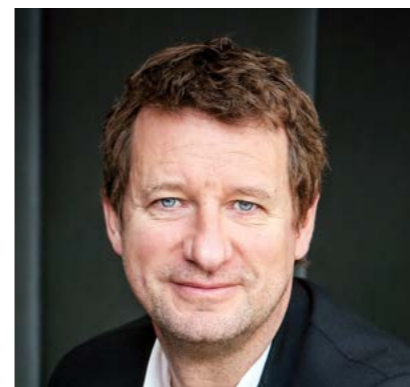
Yannick Jadot, Tête de la liste Europe Écologie à l'élection européenne.

Ce que nous écologistes voulons, c'est une Europe enfin capable d'offrir à chacun d'entre nous ce à quoi nous avons tous droit : le bonheur. C'est quoi le bonheur ? C'est de voir ses enfants grandir sereinement, dans une Europe qui va leur offrir la santé, une éducation, un travail qui ait du sens. C'est de leur permettre d'abord à ces enfants de respirer un air qui ne soit pas vicié par la pollution. De boire une eau qui ne soit pas truffée de pesticides. De croquer dans une pomme qui ne recèle pas des dizaines de résidus de produits chimiques. C'est de leur offrir un avenir dans lequel ils vont se projeter avec confiance et