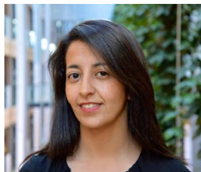
Karima Delli, Députée européenne écologiste.