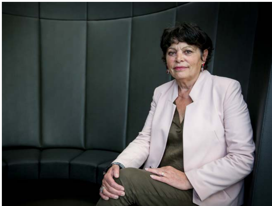
Michèle Rivasi.

«Il faut réarmer notre démocratie pour en finir avec l'emprise des lobbies»