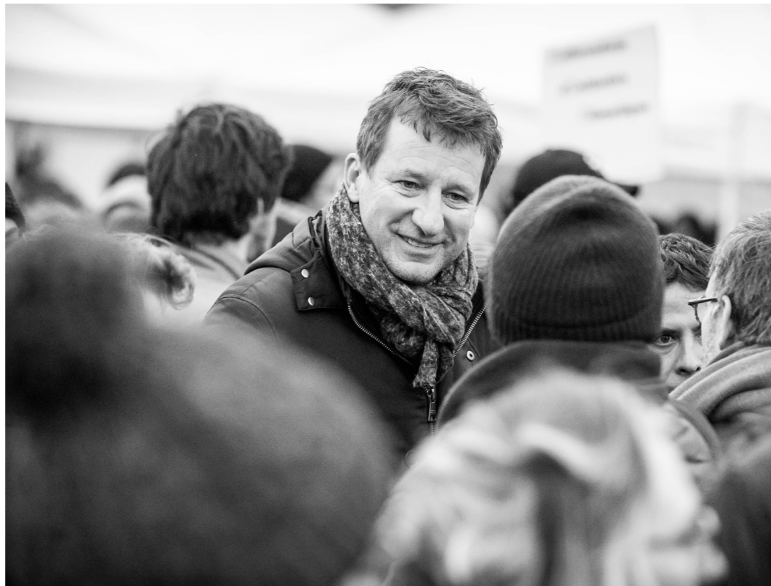
Yannick Jadot.

l'Europe est la bonne échelle pour agir. C'est naturellement que j'ai passé le pas. Et je ne regrette rien : comment la pêche électrique aurait été remise en question sans écologistes pour relayer le combat